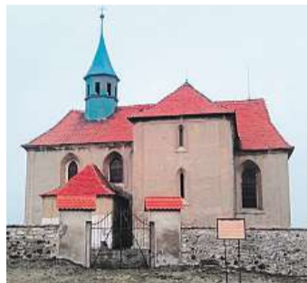
Kostel v Bedřichově Světcích Románská až raně gotická památka.