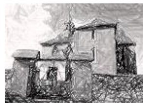
Kostel sv. Jakuba v B. Světci