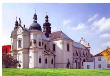
Cisterciácký klášter Osek